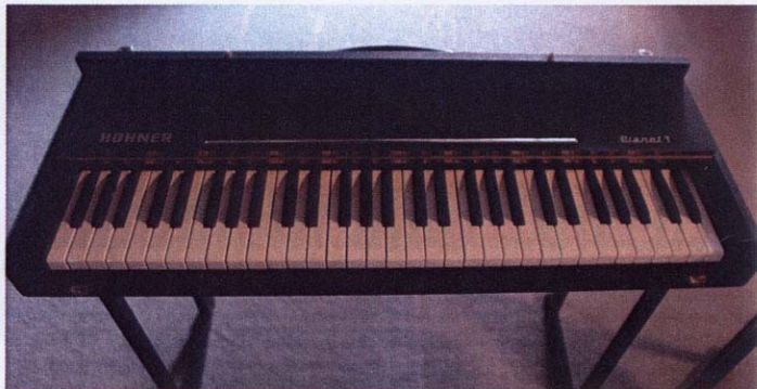
Auch eine Erfindung von Ernst Zacharias: Das Pianet T ist heute noch wegen seines glockigen Sounds beliebt.

Ein sehr seltenes Modell: Das Beat-Spinett auf Basis des Clavinet C kam unter dem Label Echolette heraus und besaß als Besonderheit eine Halterung für einen Aschenbecher auf der rechten Seite.