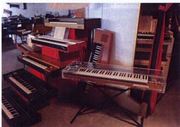
20 Jahre Clavinet-History auf 2 qm (v.o.n.u.): Die Modelle 1, C, D6, E7, Clavinet-Pianet DUO. Das Modell aus Plexiglas stammt aus dem Besitz von Jazz-Pianist und Fusion-Keyboarder George Duke.

Man muss sich vor Augen halten, welchen Erfolg die Serie dieser fünf Modelle beschreibt: