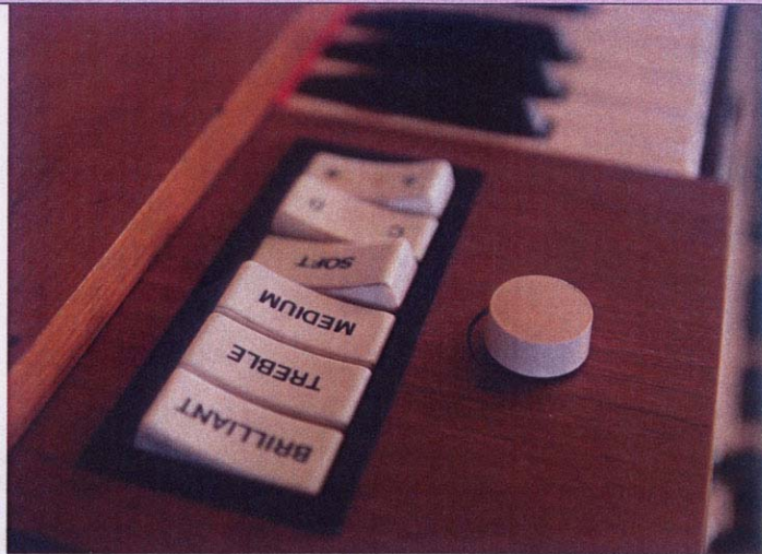
Die Filterschalter des Hohner Clavinet D6