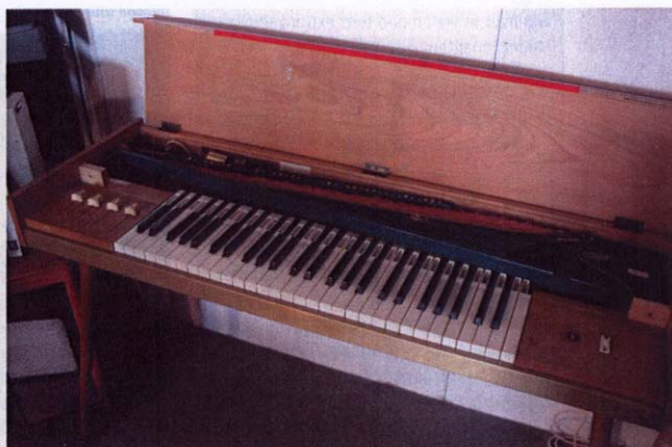
Das erste Clavinet. Der Anschlagmechanismus wurde bei den Nachfolgern geändert, ansonsten wurde der Grundaufbau dieses Instruments weitgehend übernommen.